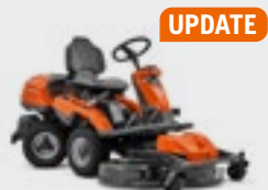
Husqvarna R 320X AWD

Husqvarna Motor, Hydrostatikgetriebe Optionale Mähdecks: Combi 94, Combi 103, Combi 112