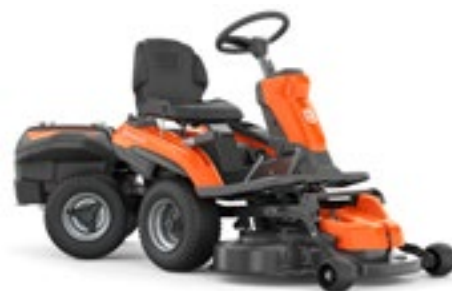
Heute Husqvarna R 200iX

kam, als sich ein Husqvarna Ingenieur mit dem Anhänger des Spielzeugtraktors seines Kindes beschäftigte. Das war der Anfang einer in 1987 patentierten Idee: Eine sich drehende Hinterachse mit dem Mähelement im Frontbereich und dem Sitz als Zentrum.