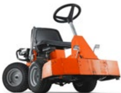
1987 Ein früher Prototyp

Bereits seit 36 Jahren werden Rider der Marke Husqvarna weltweit verkauft. Doch was macht unsere Rider so besonders? Mit unseren Husqvarna Ridern mähen Sie in Bereichen, die Sie nie für möglich gehalten hätten – z. B. an engen Stellen, auf Böschungen und in unterschiedlichstem Terrain. Sie werden jedoch feststellen, dass ein Husqvarna Rider noch mehr zu bieten hat. Beim Design unseres Maschinensortiments wurde besonders darauf geachtet, unterschiedliche Lösungen für unterschiedliche Anforderungen anbieten zu können. Durch verschiedene Mähoptionen und ein breites Sortiment an Anbaugeräten – von Mähzubehör bis zu Schneefräsen – bietet er eine noch nie dagewesene Vielseitigkeit. 2022 präsentierte Husqvarna den ersten Akku-Rider im Sortiment. Dieses wird in diesem Jahr um einen weiteren Akku-Rider (200er Serie) ergänzt. Mit den Husqvarna Akku-Ridern ist auch das Mähen in lärmsensiblen Bereichen kein Problem.