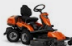
Husqvarna R 316TX AWD

Kawasaki Motor, Zweizylinder, Hydrostatikgetriebe Optionale Mähdecks: Combi 94, Combi 103, Combi 112