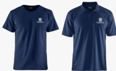
T-Shirt/Polo-Shirt UV Schutz unisex Größen SX - XXXXL