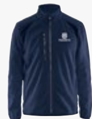
Fleecejacke unisex Größen XS - XXXXL