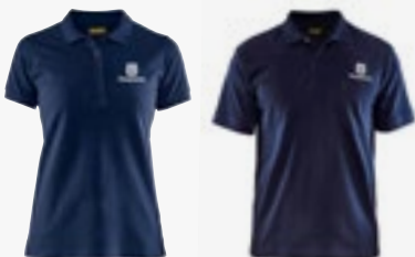
Poloshirt Damen und Herren Größen XS - XXXL (Damen) Größen XS - XXXXL (Herren)