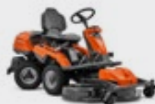
Husqvarna R 316TX

Husqvarna Motor, Hydrostatikgetriebe, Allradantrieb Optionale Mähdecks: Combi 94, Combi 103, Combi 112