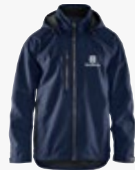
Softshelljacke unisex Größen XS - XXXXL