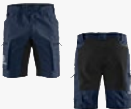
Werkstatthose kurz Größen 44 - 62