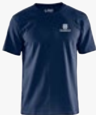
T-Shirt unisex Größen XS - XXXXL