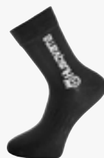
Husqvarna Socken Größen 36 - 39, 40 - 44, 45 - 48