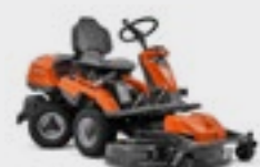
Husqvarna R 316TsX AWD

Kawasaki Motor, Zweizylinder, Hydrostatikgetriebe, Allradantrieb Optionale Mähdecks: Combi 94, Combi 103, Combi 112